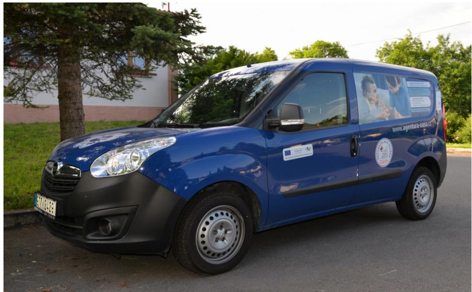
Vůz pečovatelské služby

Všechny pracovnice jsou vybaveny mobilními telefony, které umožňují v případě potřeby urychlené spojení s centrálou firmy a řešení problémů, které v terénu mohou nastat. K jednotlivému uživateli se každá pracovnice v sociálních službách přepravuje pomocí osobního firemního automobilu. Díky dotačnímu programu ROP Moravskoslezsko máme v našem vozovém parku 4 vozy OPEL Combo. Mezi významné změny v roce 2017 je nutno uvést změnu provozovny firmy. Z obce Raduň jsme se přestěhovali do nových kancelářských prostor v Opavě na ulici Hradecká 668/1 v Opavě. Další změnou je změna názvu firmy na OASA nezisková o.p.s.