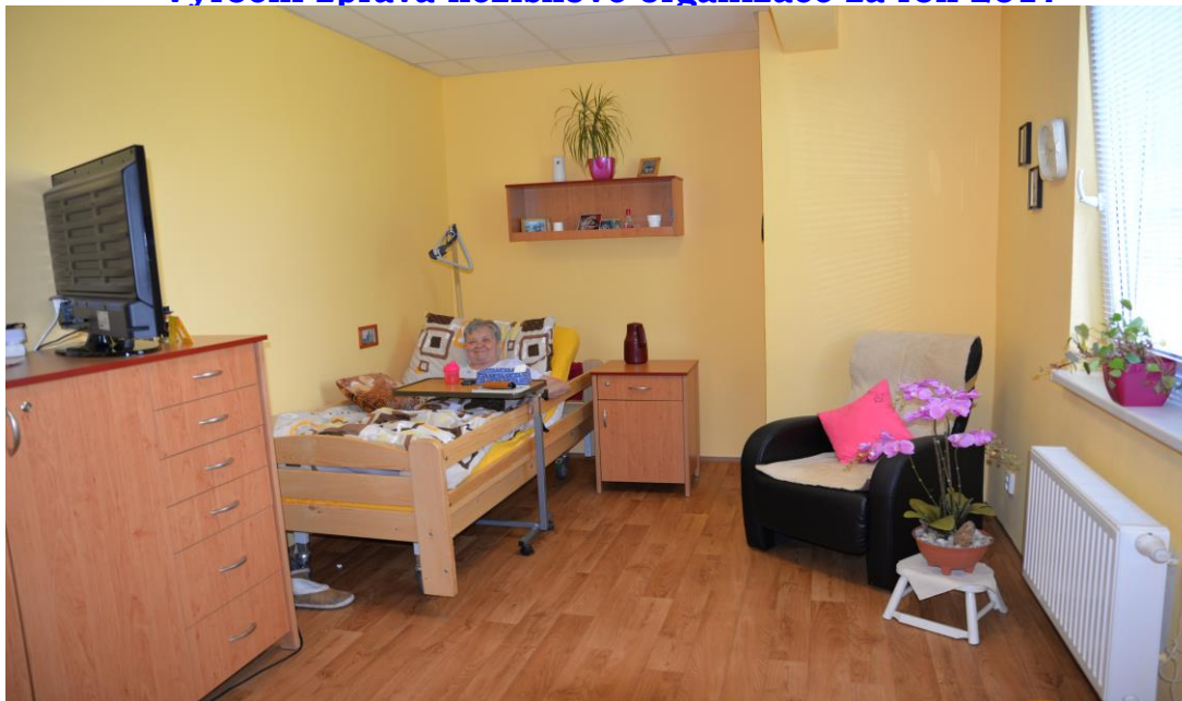
Jednolůžkový pokoj v domově se zvláštním režimem

Zajištění péče se vztahuje k individuálním potřebám každého uživatele s přihlédnutím k jeho schopnostem a možnostem. Našími službami chceme zajistit důstojné prožívání života, zapojení do společenského dění a respektování jeho lidských práv. Potřeba péče, podpory a dohledu jsou takové, že je nelze zajistit jiným způsobem (péčí rodinných příslušníků, terénními, či ambulantními službami) nebo chybí rodinné zázemí, či neplní své funkce dostatečným způsobem.