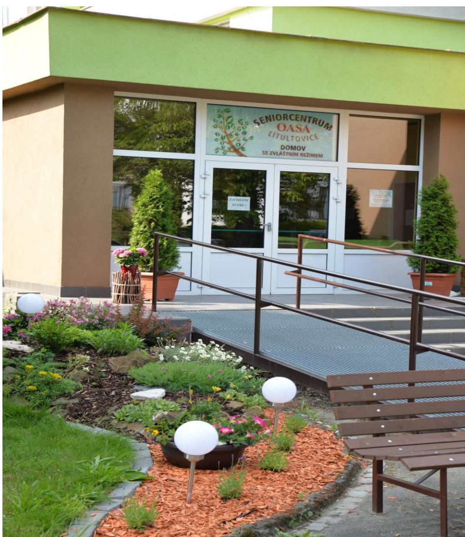
Domov se zvláštním režimem

Provoz Domova se zvláštním režimem zahájen 1.9.2014.