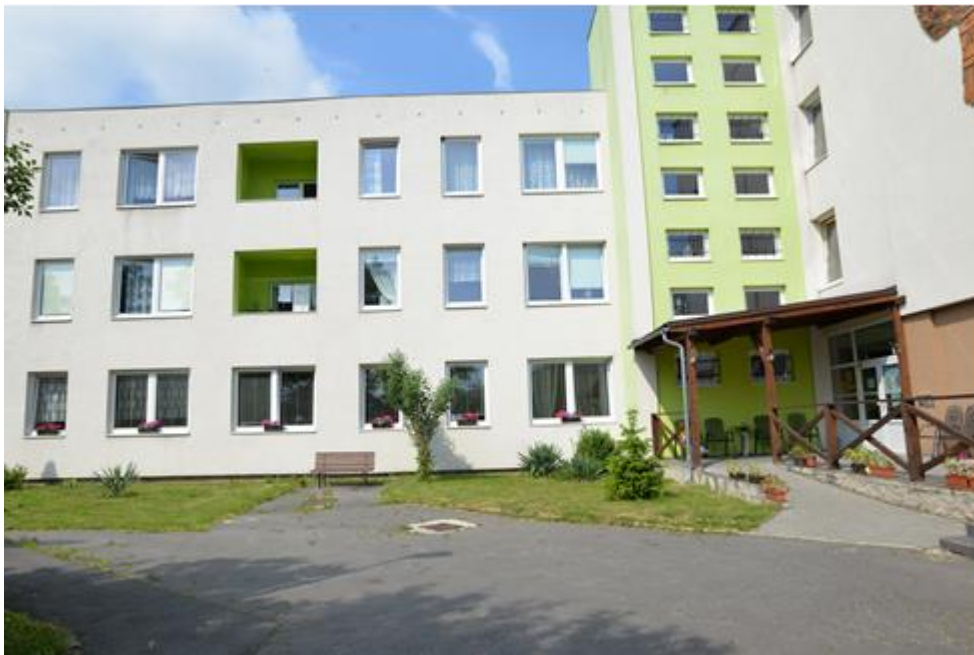
byty s pečovatelskou službou

V roce 2017 byla i nadále poskytována terénní pečovatelská služba v Seniorcentru OASA v Litultovicích. Péče je poskytována v rozsahu 24 hodin denně ubytovaným seniorům.